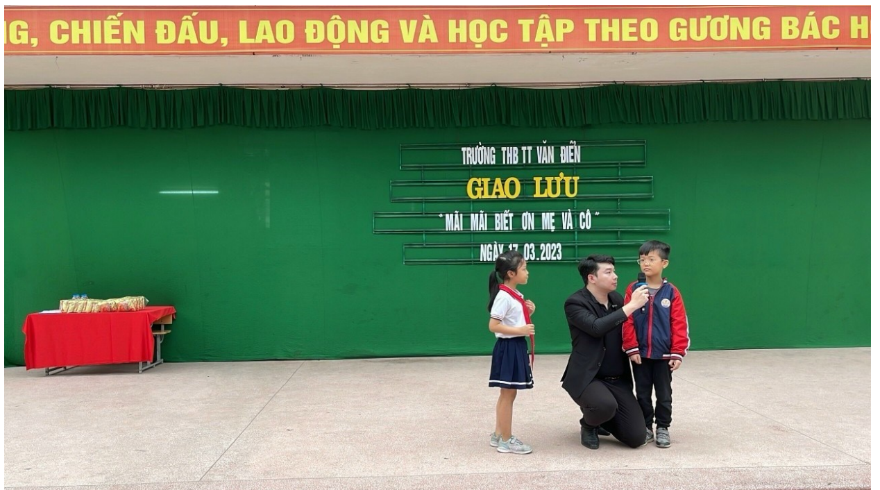
Giao lưu giáo dục học sinh Lòng biết ơn