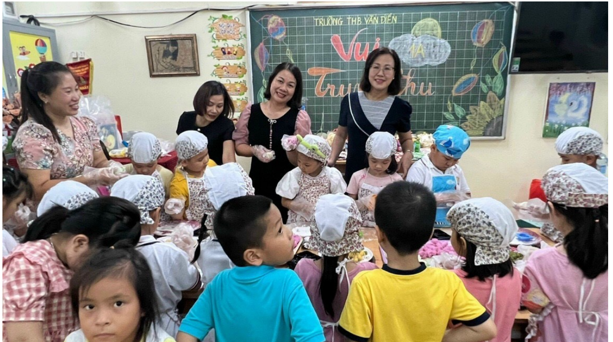
Học sinh lớp 1A trải nghiệm làm bánh trung thu