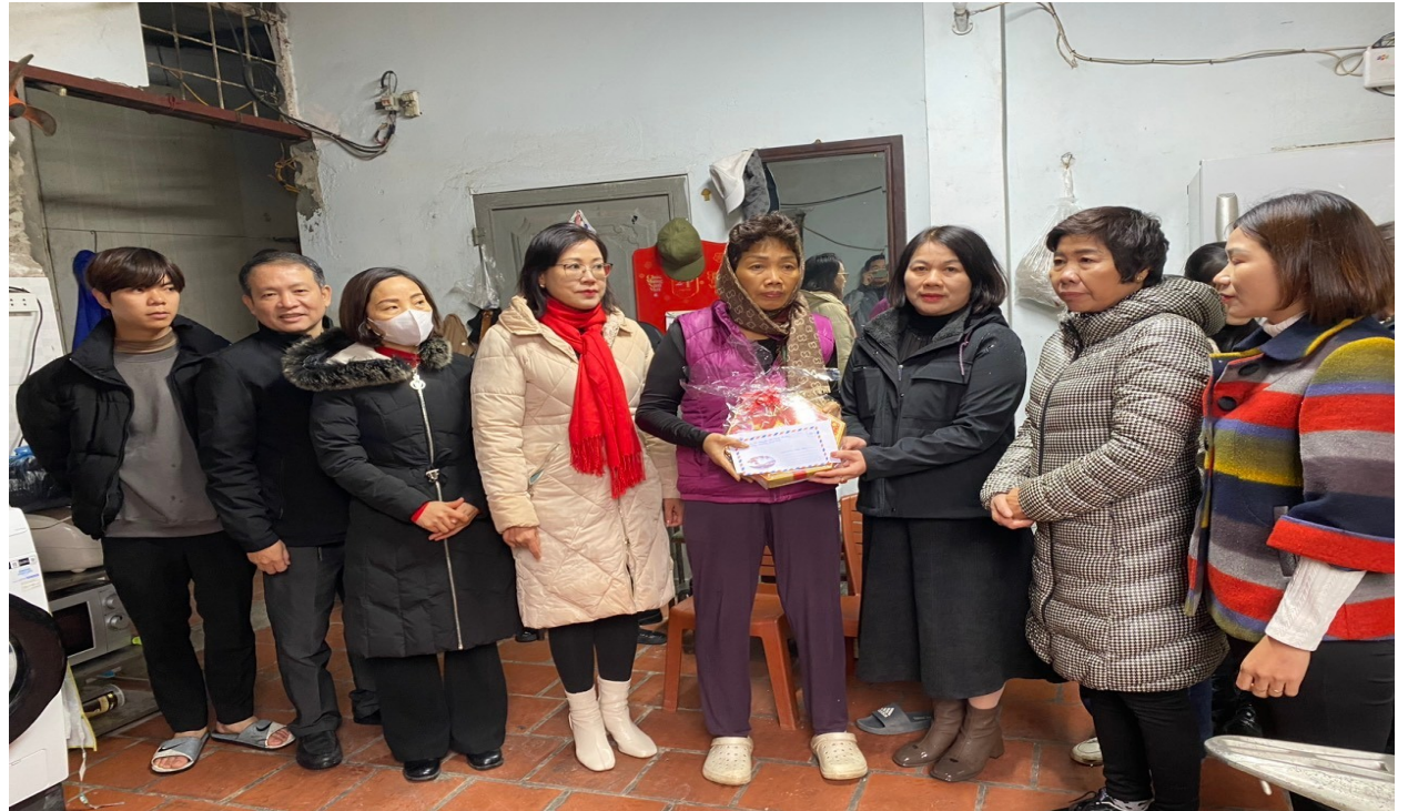
Tặng quà nhân dịp Tết nguyên đán tại các địa chỉ đỏ xã Tam Hiệp