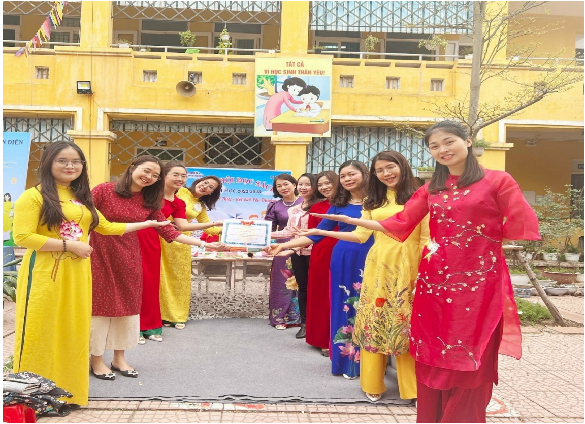
Ngày hội đọc sách năm học 2022-2023