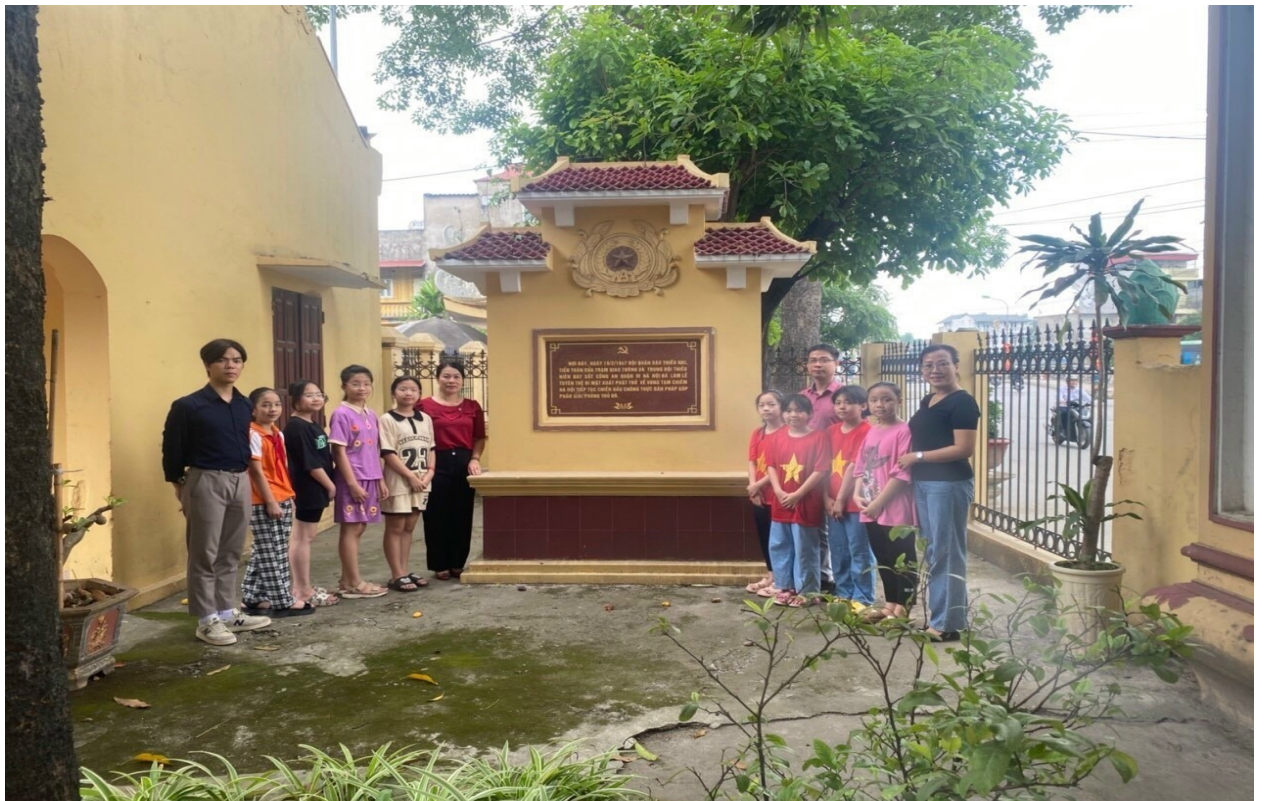
Các thầy cô giáo cùng các em học sinh thăm Đình Đông, Tam Hiệp nơi lưu giữ Bia ghi danh các chiến sĩ tình báo tí hon trong “Đội thiếu niên tình báo Bát Sắt”