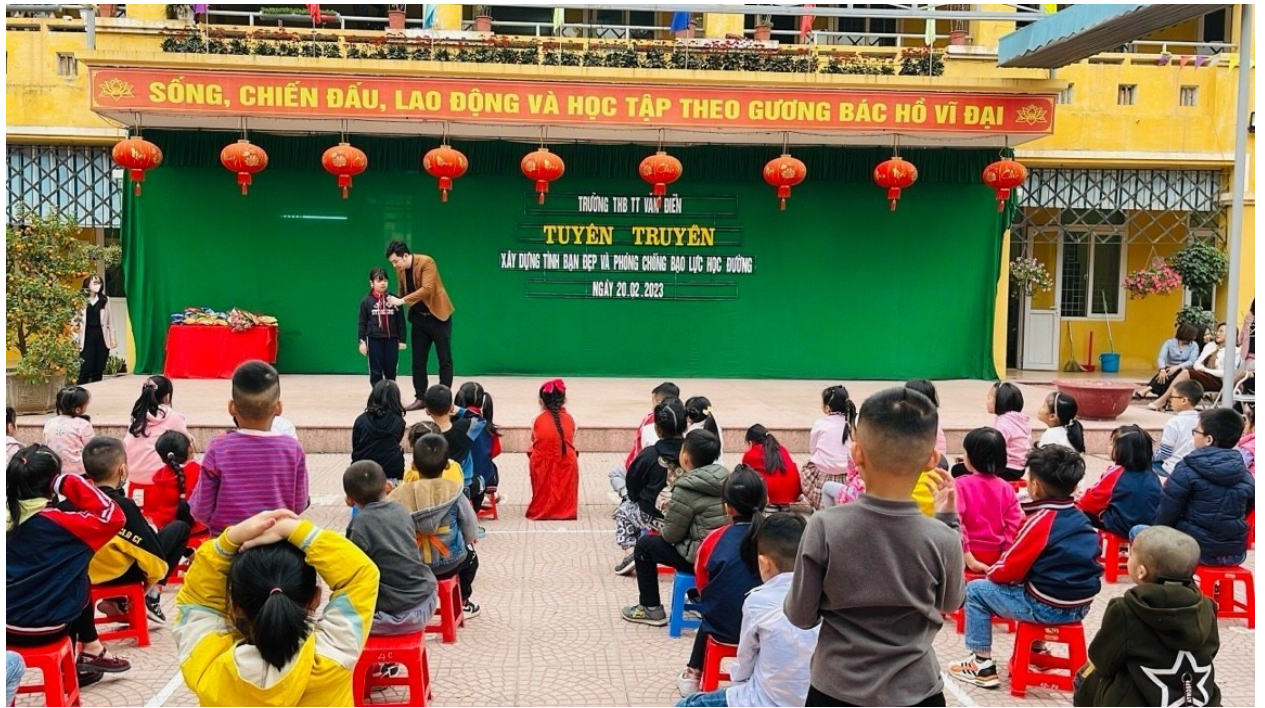
Tuyên truyền xây dựng tình bạn đẹp và phòng chống bạo lực học đường