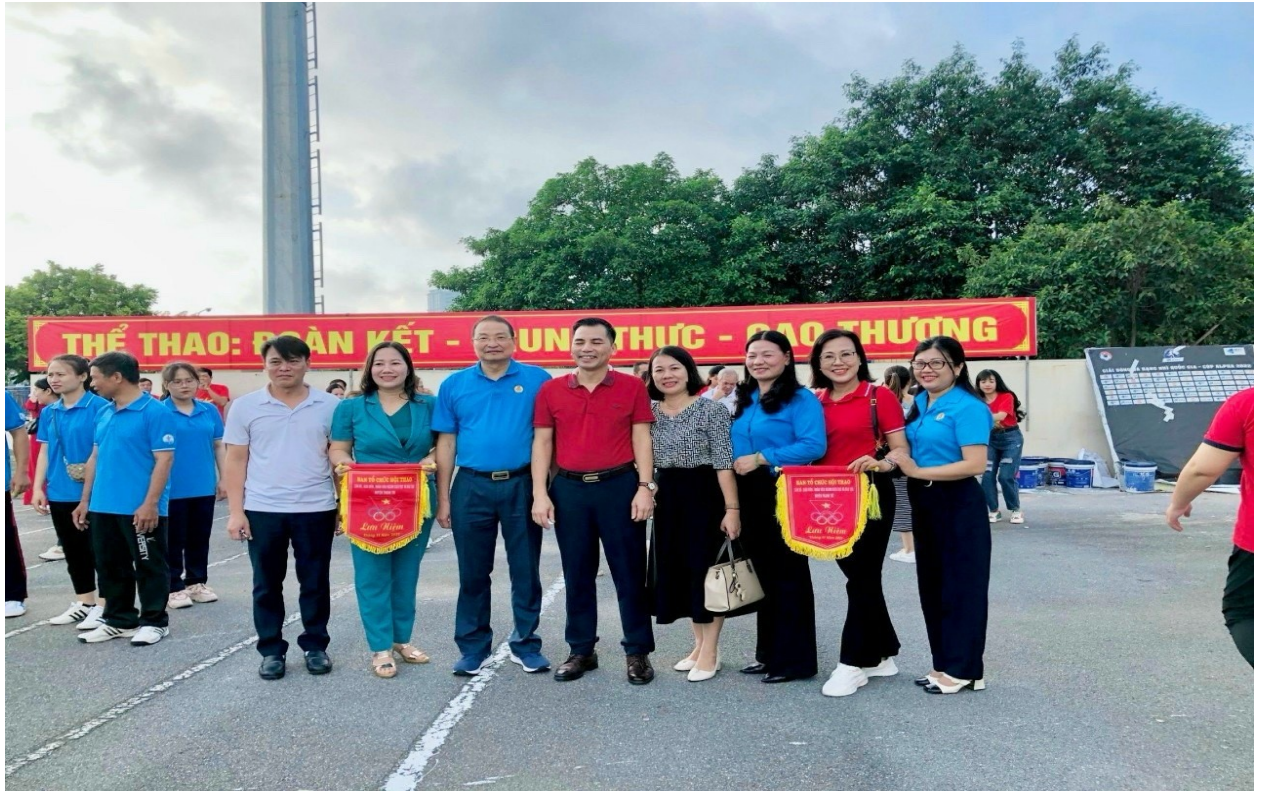
Ban giám hiệu nhà trường cùng các đ/c lãnh đạo TP, huyện