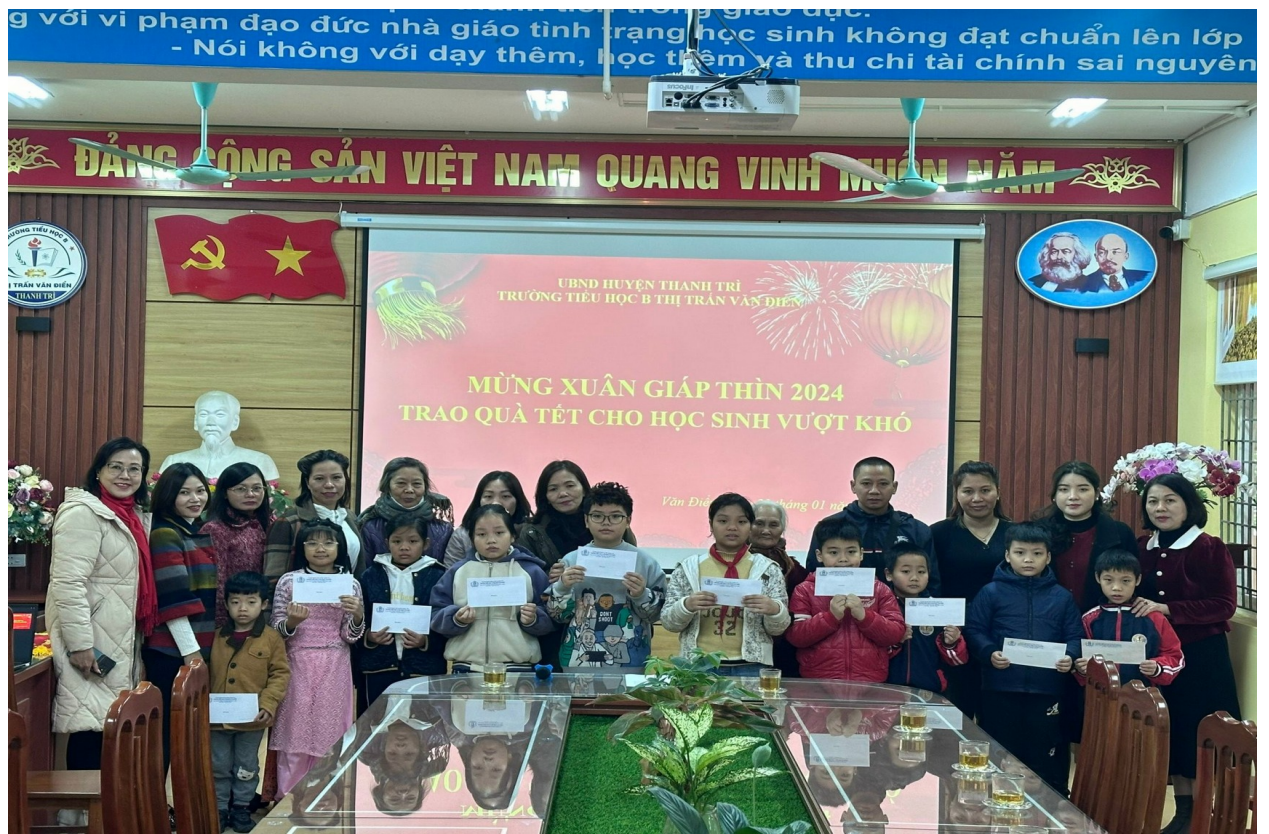
Trao quà Tết cho học sinh vượt khó