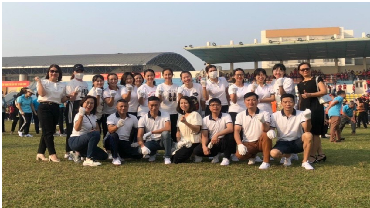
Đội kéo co chụp ảnh lưu niệm tại sân vận động Nhà thi đấu TDTT huyện

Ngoài công việc chuyên môn, cô luôn chú trọng rèn luyện sức khỏe, nâng cao tinh thần thể dục thể thao cho CB, GV, NV nhà trường bằng việc động viên công đoàn viên nhà trường tham gia các cuộc thi về sức khỏe, hội thi thể dục thể thao. Cô luôn truyền lửa, ủng hộ và động viên các đồng nghiệp cùng nhau chăm chỉ không chỉ trong công việc mà còn cả luyện tập thể dục. Năm học 2023 – 2024 đội kéo co của nhà trường đã giành Huy chương đồng lần đầu tiên sau 15 năm kể từ khi tách trường.