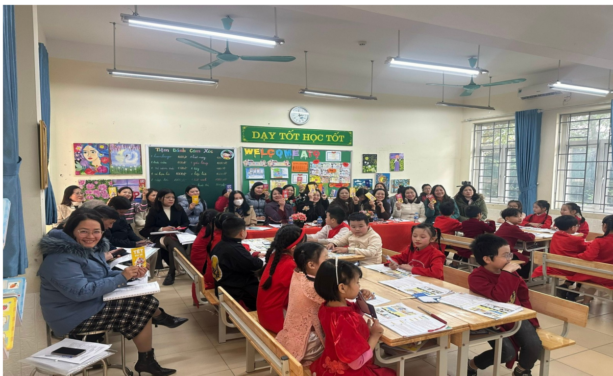
Chuyên đề Đạo đức cấp huyện Năm học 2023 – 2024