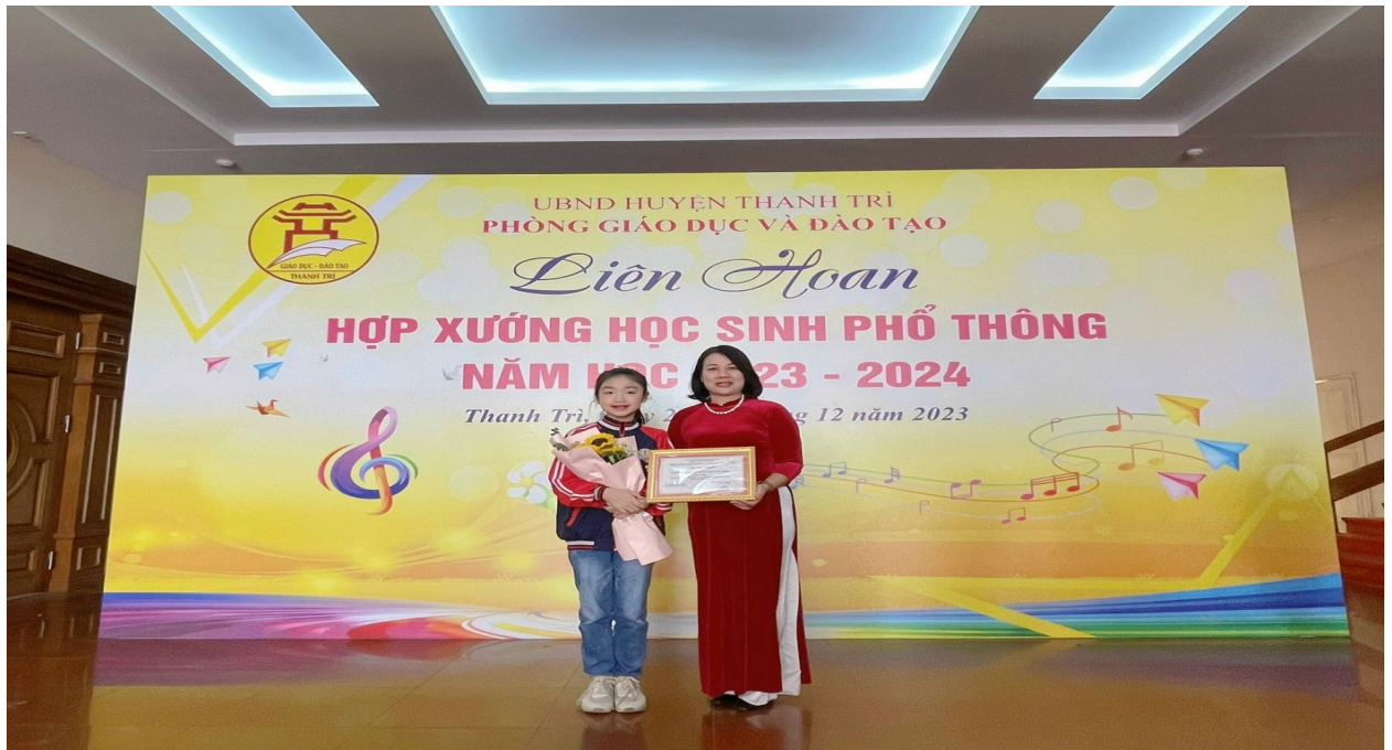
Học sinh tham gia các Hội thi văn nghệ của ngành giáo dục