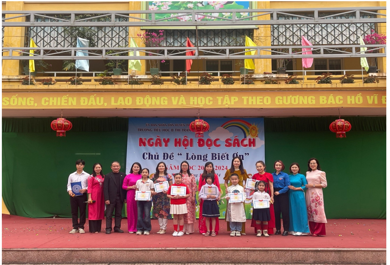
Ngày hội đọc sách năm học 2023-2024