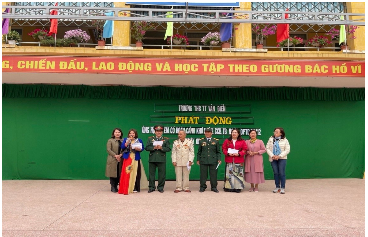
Giáo dục học sinh truyền thống của dân tộc