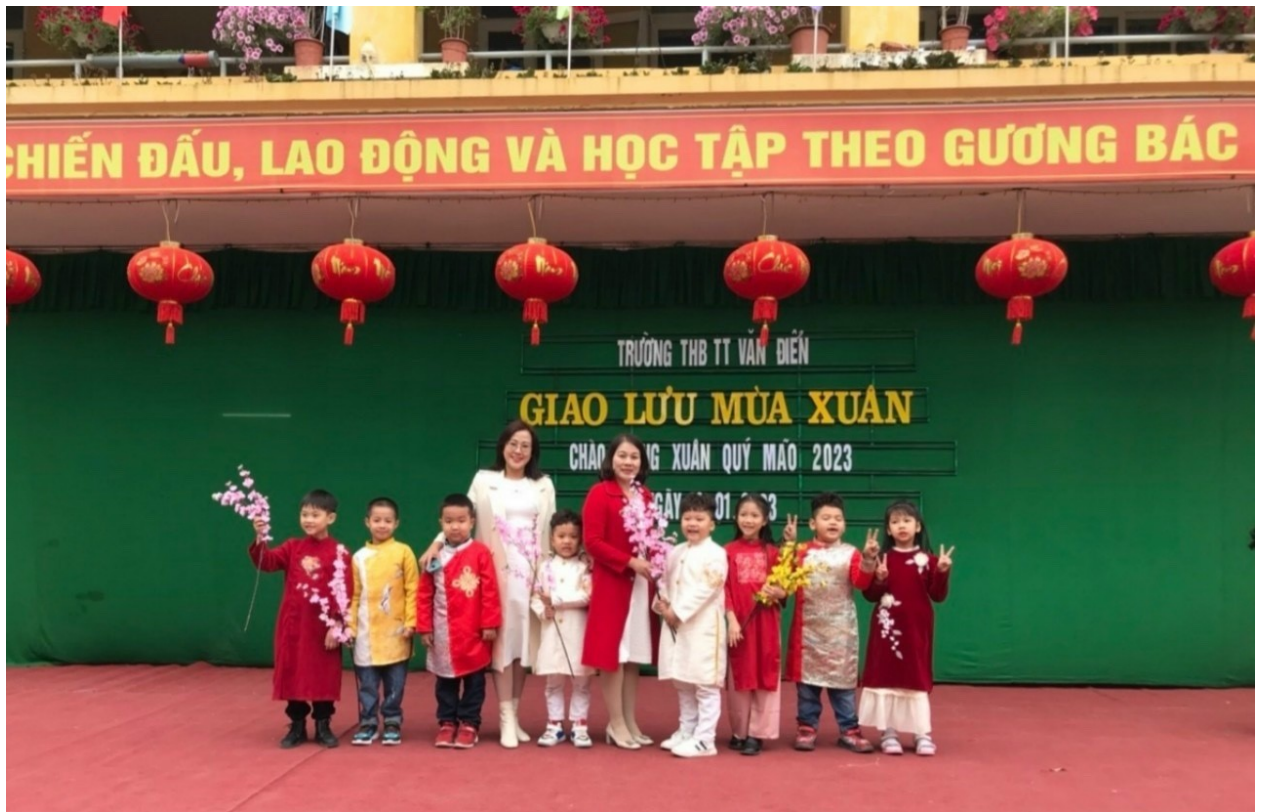
Học sinh tham gia các Hội thi văn nghệ của ngành giáo dục