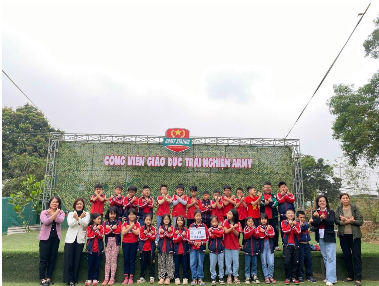
Thăm quan trải nghiệm tại Công viên giáo dục

Bằng tình cảm chân thành, tấm lòng yêu mến học sinh như con và sự quan tâm sâu sắc của cô đối với trò đã để lại ấn tượng tốt đẹp trong lòng học sinh và phụ huynh. Cô luôn được học sinh, phụ huynh và đồng nghiệp yêu mến, tin tưởng. Cô gần gũi, giản dị, chân thành và ấm áp với mọi người. Đó là niềm hạnh phúc to lớn của người giáo viên khi được học trò, phụ huynh dành cho những tình cảm tri ân.