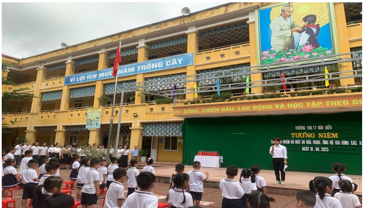
Lễ tưởng niệm và ủng hộ các nạn nhân vụ cháy chung cư mini tại Thanh Xuân