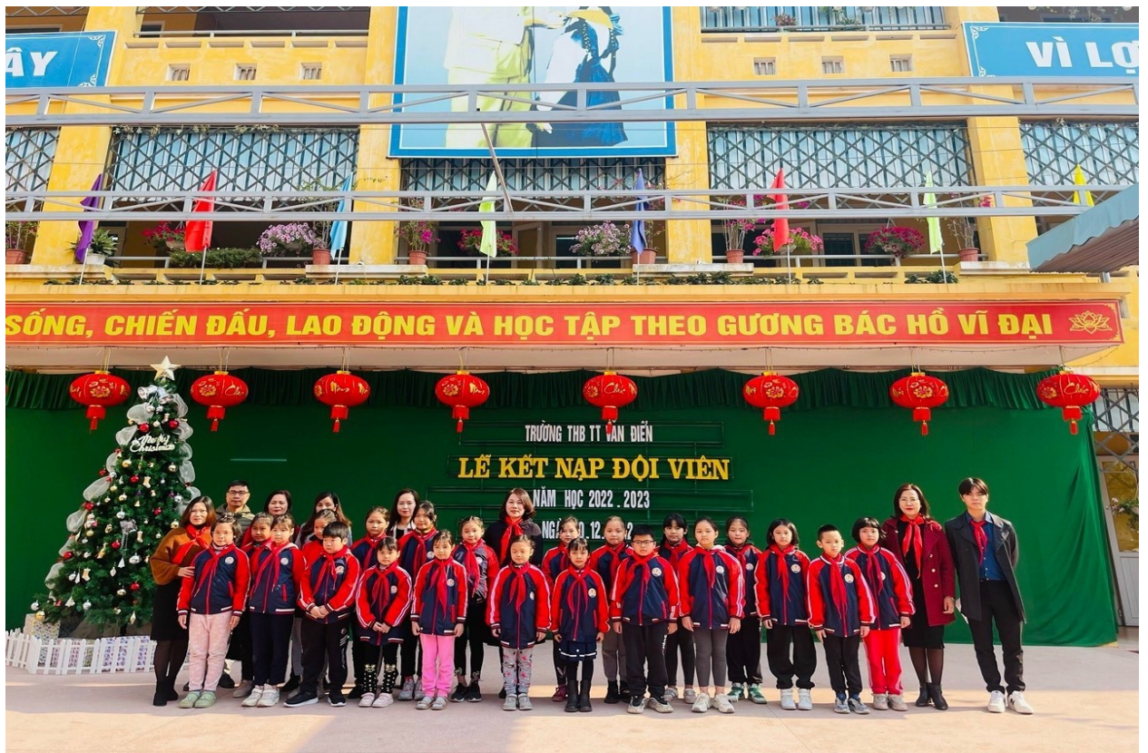
Giáo dục truyền thống noi gương anh bộ đội Cụ Hồ