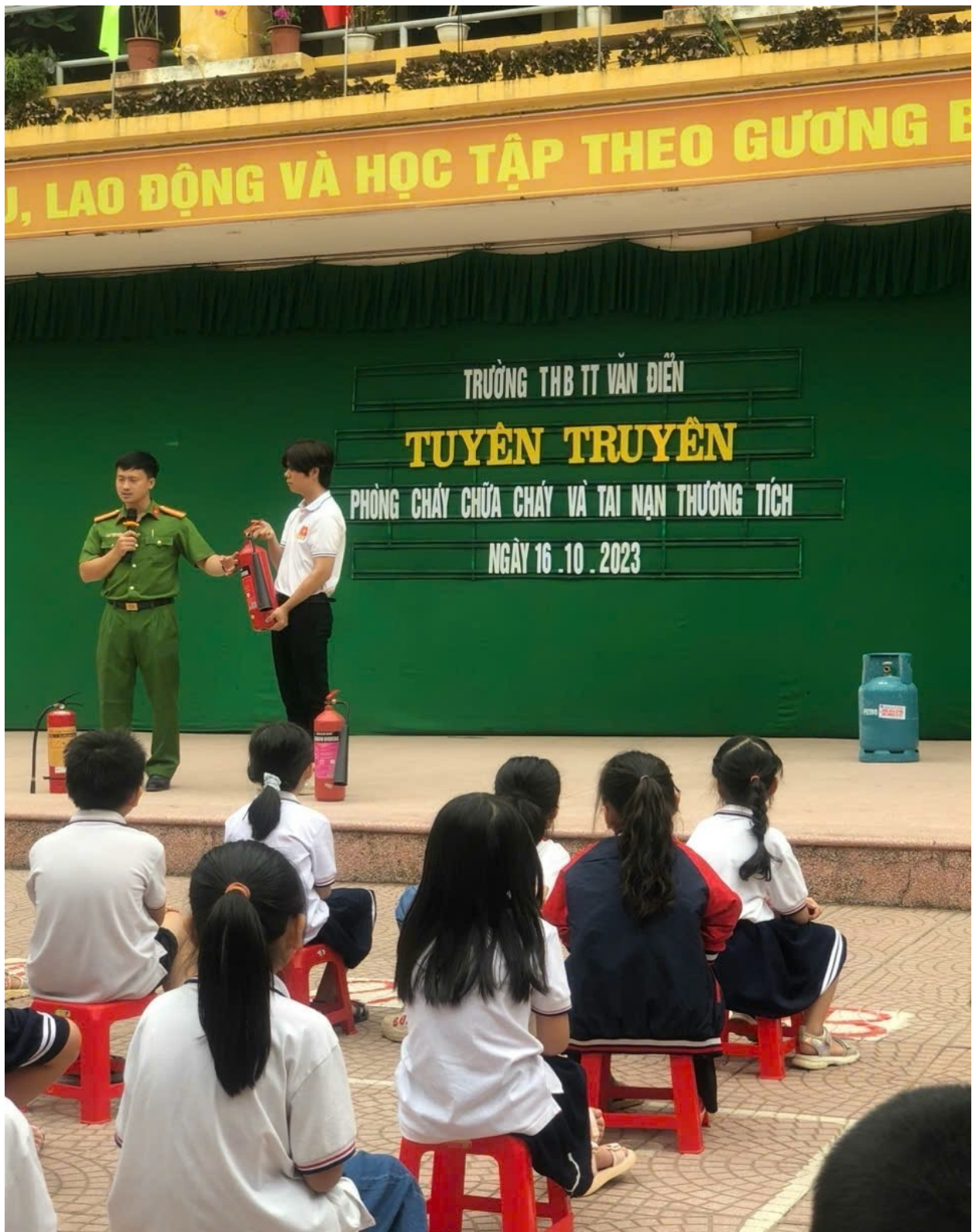
Tuyên truyền phòng cháy chữa cháy cho học sinh và giáo viên, nhân viên