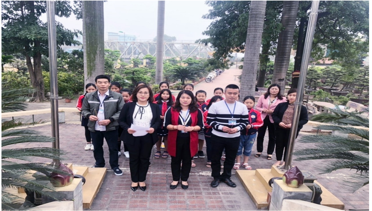
Các thầy cô giáo cùng các em học sinh viếng Đài tưởng niệm liệt sĩ TTVD