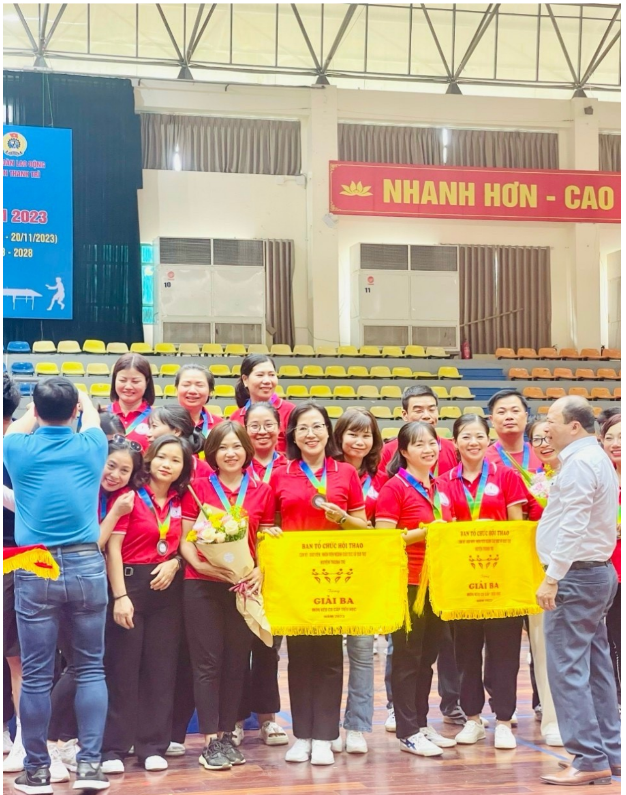
Đội kéo co giành Huy chương đồng năm học 2023 - 2024