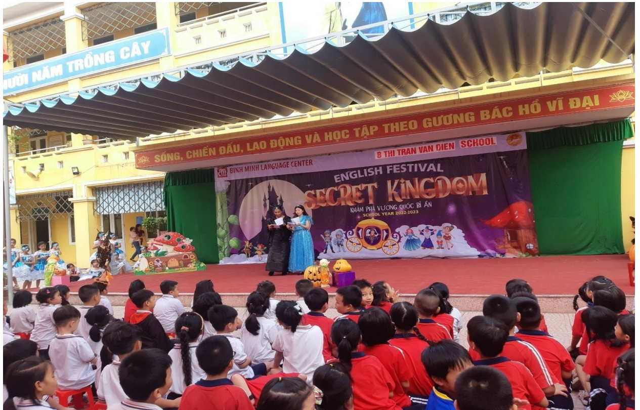
Lễ hội mùa xuân