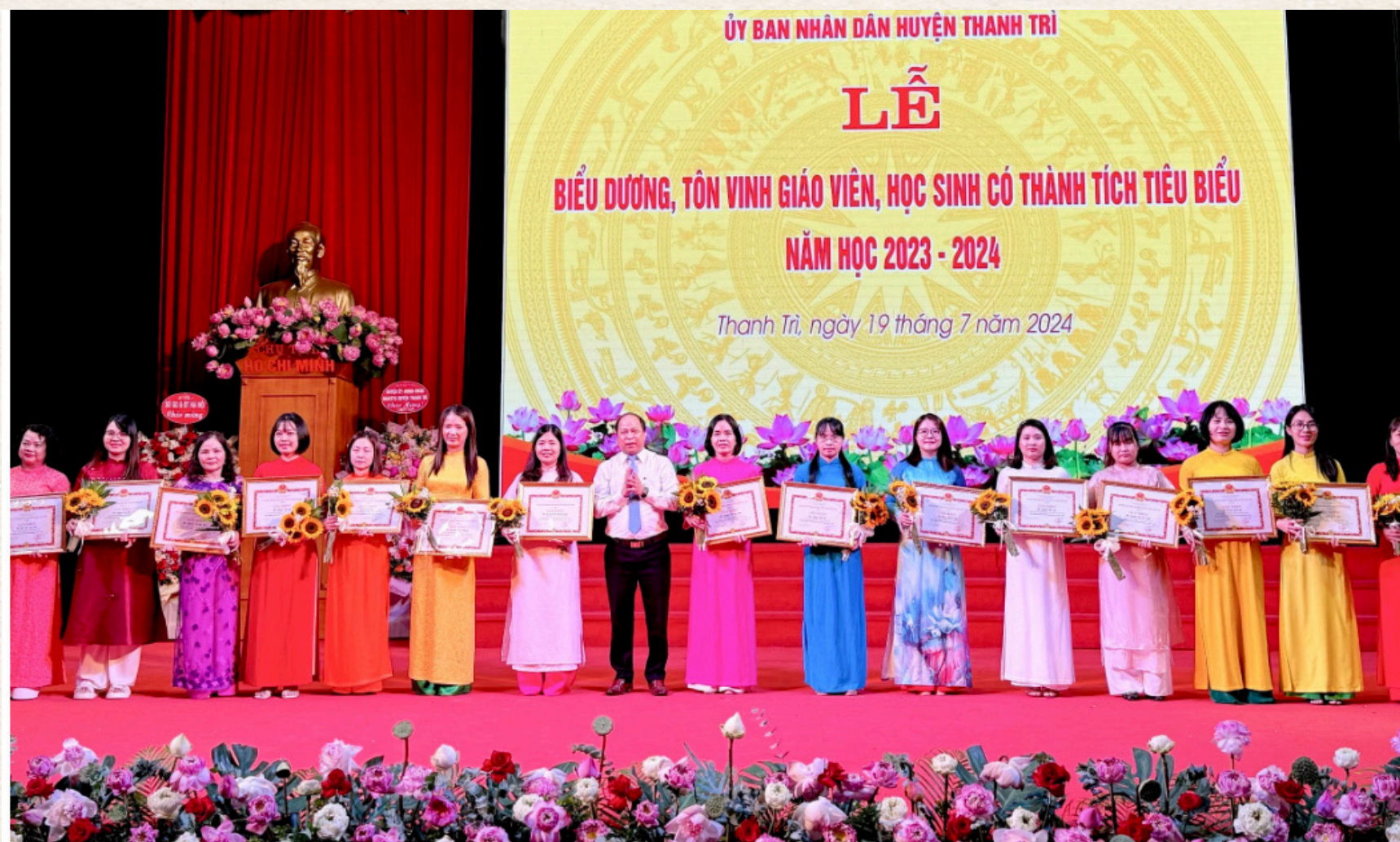
Các giáo viên có thành tích cao năm học 2023-2024 được UBND huyện Thanh Trì biểu dương