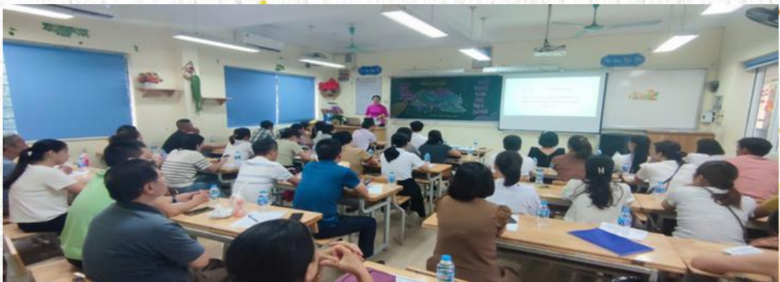
Phụ huynh tin tưởng đồng hành cùng cô