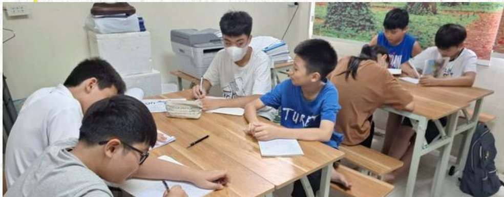
Dự án lớp học không đồng hè 2024