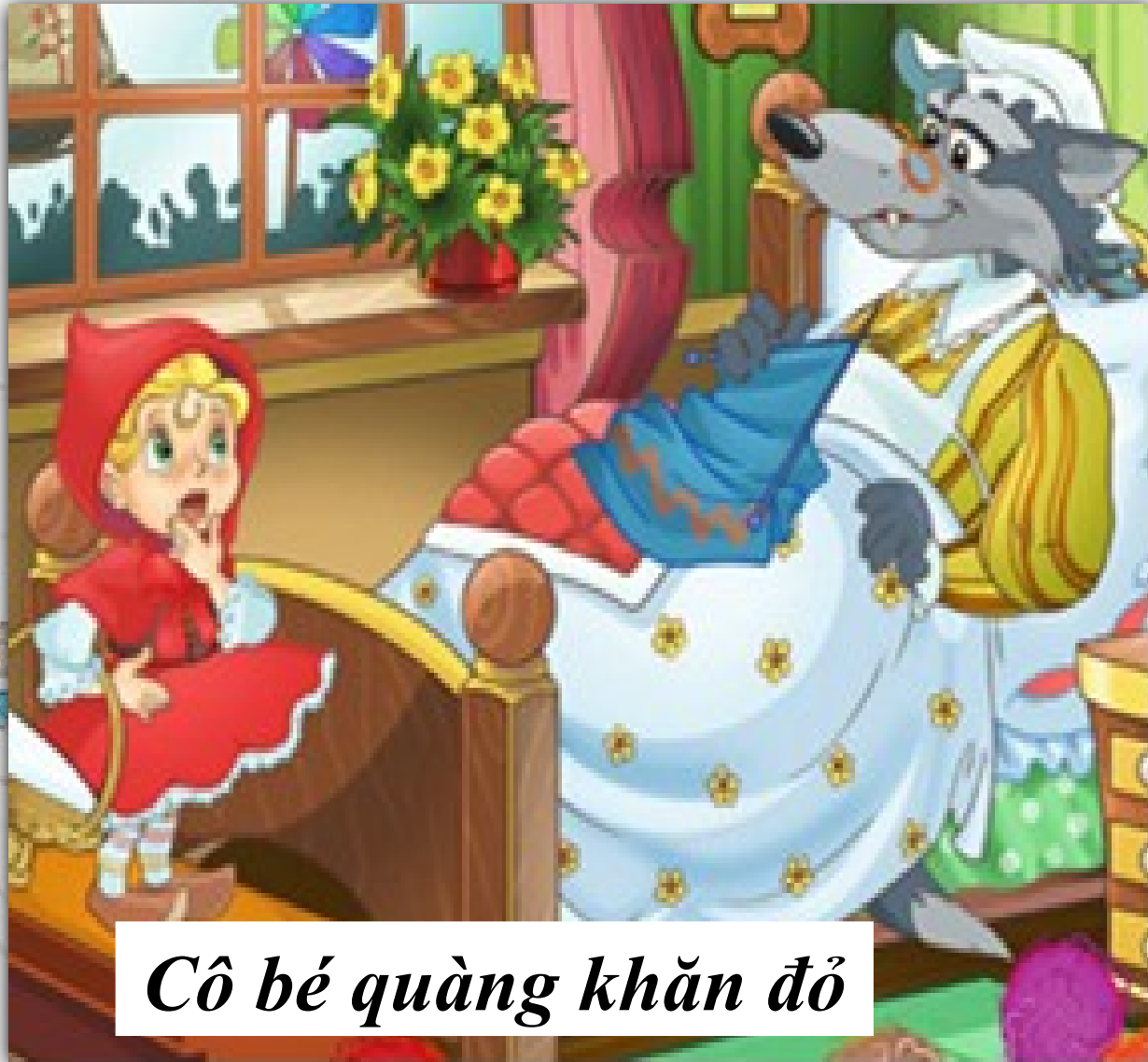
Cô bé quàng khăn đỏ