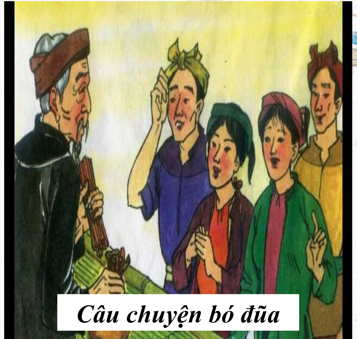
Câu chuyện bó đũa