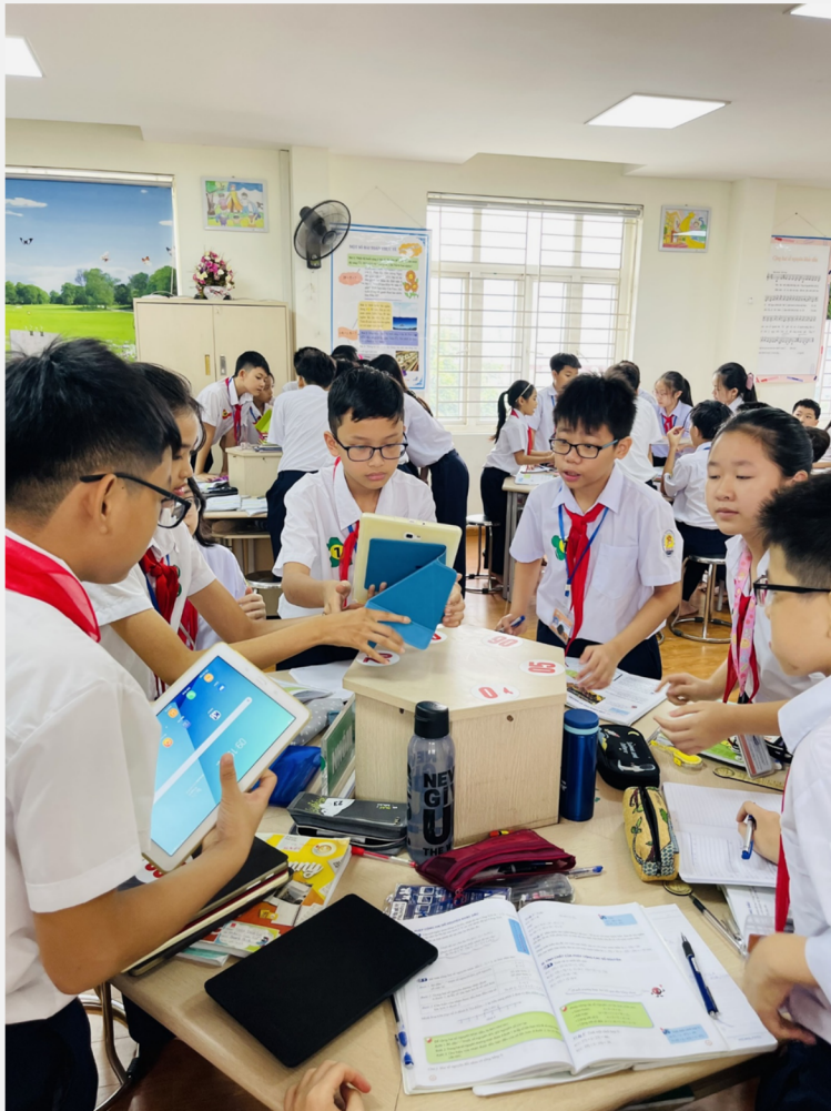
Hình ảnh một giờ hoạt động ngoại khóa lớp cô Trang

+ Năm 2021 - 2022 có một học sinh đạt giải nhì, ba em đạt giải khuyến khích.