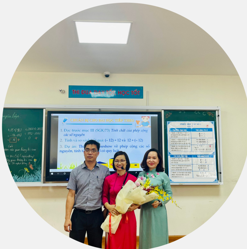
Một số hình ảnh về cô Trang